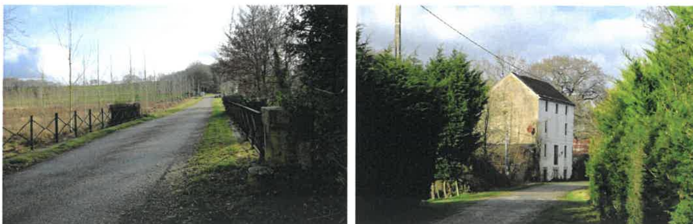
Pont et moulin de SIVIAC (images S&M le 29-01-20)

L'histoire des lieux est liée à celle de ses moulins à Siviac et au Roscoët notamment, ainsi qu'aux nombreux ponts qui la franchissent.