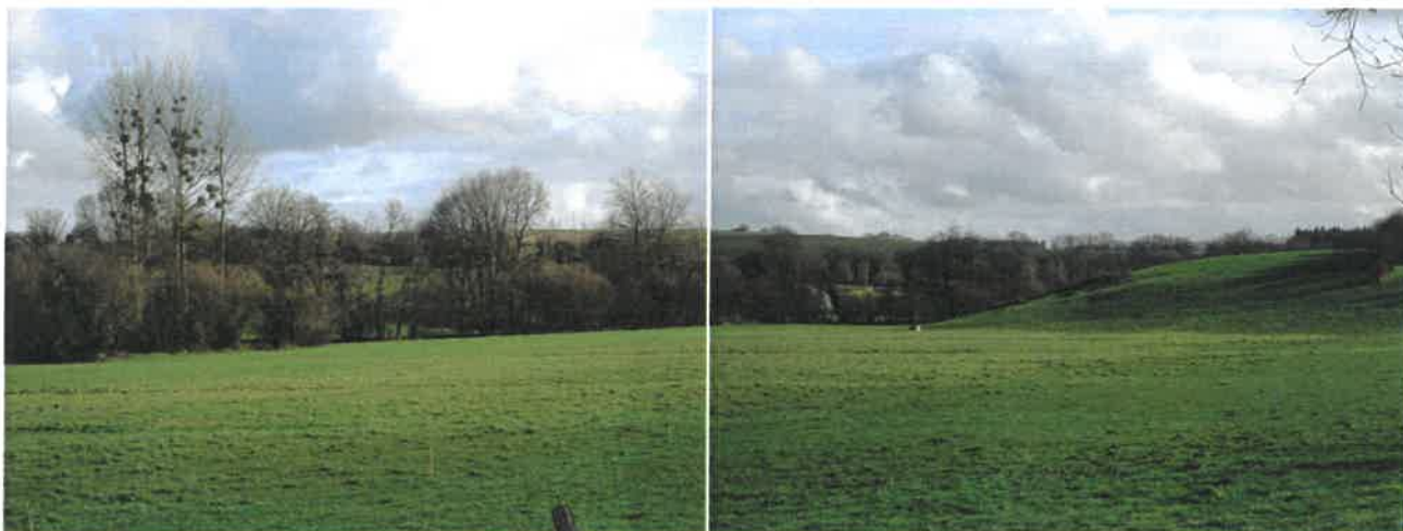
La vallée de l'EVEL (Naizin EVELLYS) vue de la route Siviac/Naizin, face au site retenu par ENERCON Images S&M du 29-01-20

« Cette sensation continue de plateau jamais complètement plat alimente l'image d'un paysage infini, sans cesse renouvelé » lit-on dans l'atlas des paysages du Morbihan.