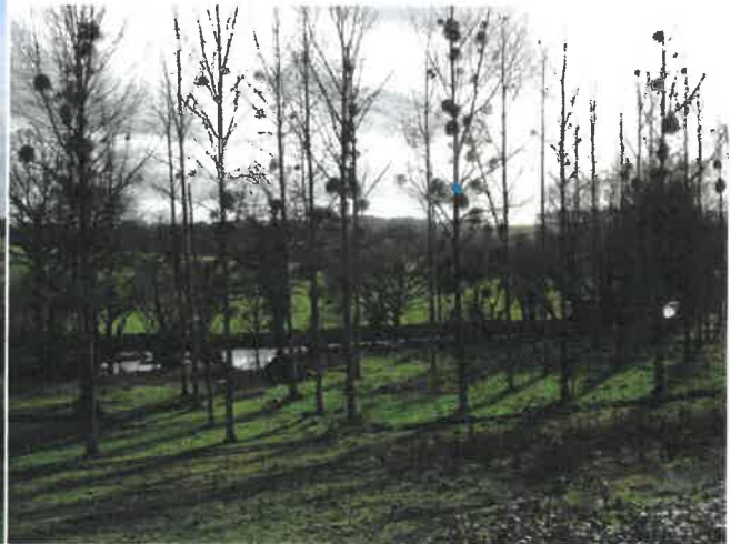
Vallée de l'EVEL vue de LE NET (Naizin EVELLYS) images S&M le 29-01-20