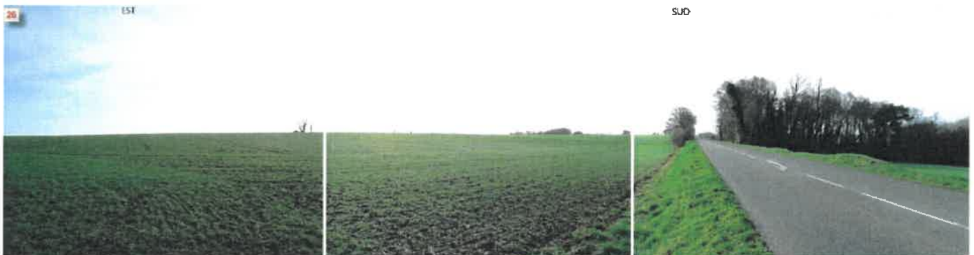
Vue panoramique depuis le centre du projet, sur la RD 17

On ne peut que s'indigner des vues présentées par CENA PAYSAGE