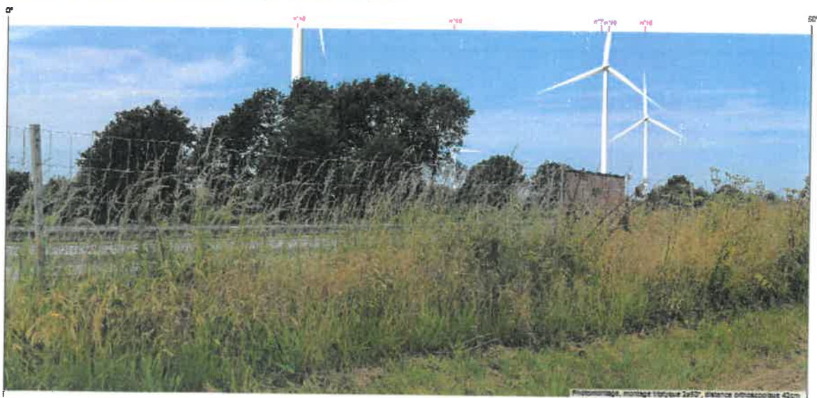
Photomontage n°51 - Vue depuis la RD 724 aux abords de la RN 24

L'observateur s'est tapi derrière la végétation du bord de route pour présenter une vue de premier plan sur des éoliennes tronquées, alors qu'il devait nous présenter une vue éloignée sur le projet de Moréac ...!