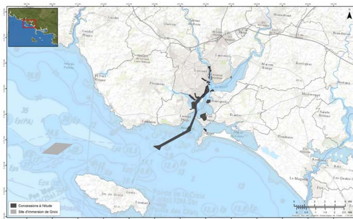
Figure 1 – Sites portuaires concernés par les dragages et site envisagé pour le clapage.

La rade de Lorient étant soumise à un envasement progressif naturel, plus ou moins rapide selon les endroits, des dragages d'entretien ont été réalisés de longue date par chacun des opérateurs (Région Bretagne, la Compagnie des ports du Morbihan- Société publique créée par le Conseil départemental du Morbihan, Lorient agglomération et le groupe DCNS –aujourd'hui, Naval Group). Ainsi ces 20 dernières années, c'est un volume total de 2,8 Mm 3 (soit en moyenne 140 000 m 3 /an) qui ont été dragués. Ces volumes sont relativement importants comparés aux autres ports bretons (400 000 m 3 /an pour l'ensemble des ports bretons), mais faibles à l'échelle nationale (5 millions de m 3 /an).