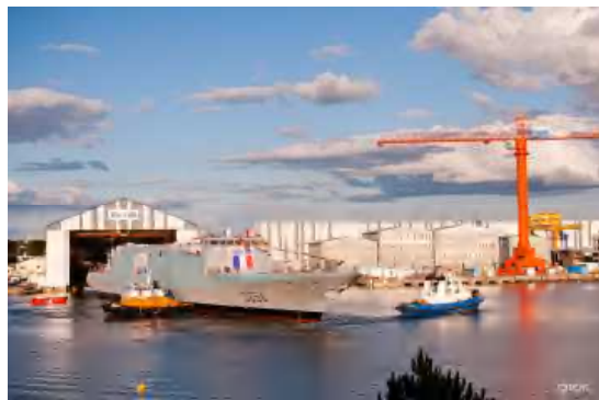
Photo 1 : Frégate Fremm à la sortie de la forme de construction des chantiers NAVAL GROUP de Lorient

Le maintien d'une cote d'exploitation adaptée sur la zone d'évolution du navire en construction est donc un enjeu très fort pour NAVAL GROUP car le site doit garantir :