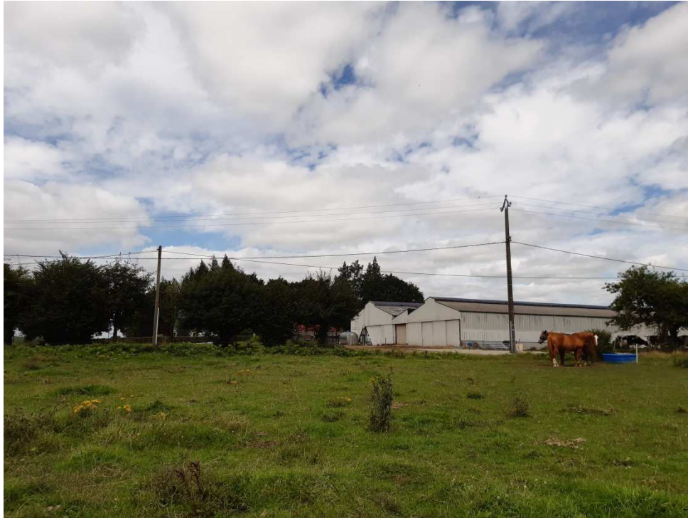
Vue du sud