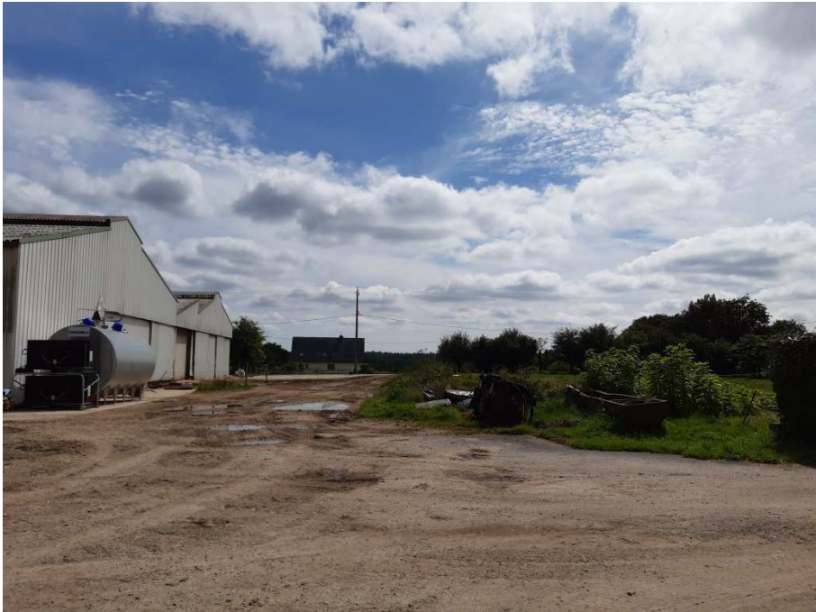
Vue du nord