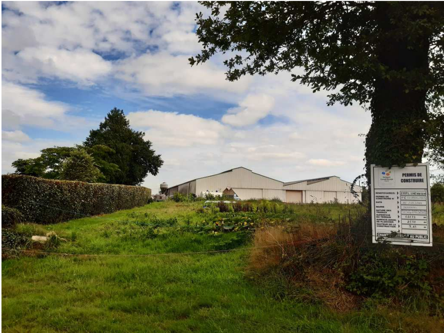
Vue de l'ouest