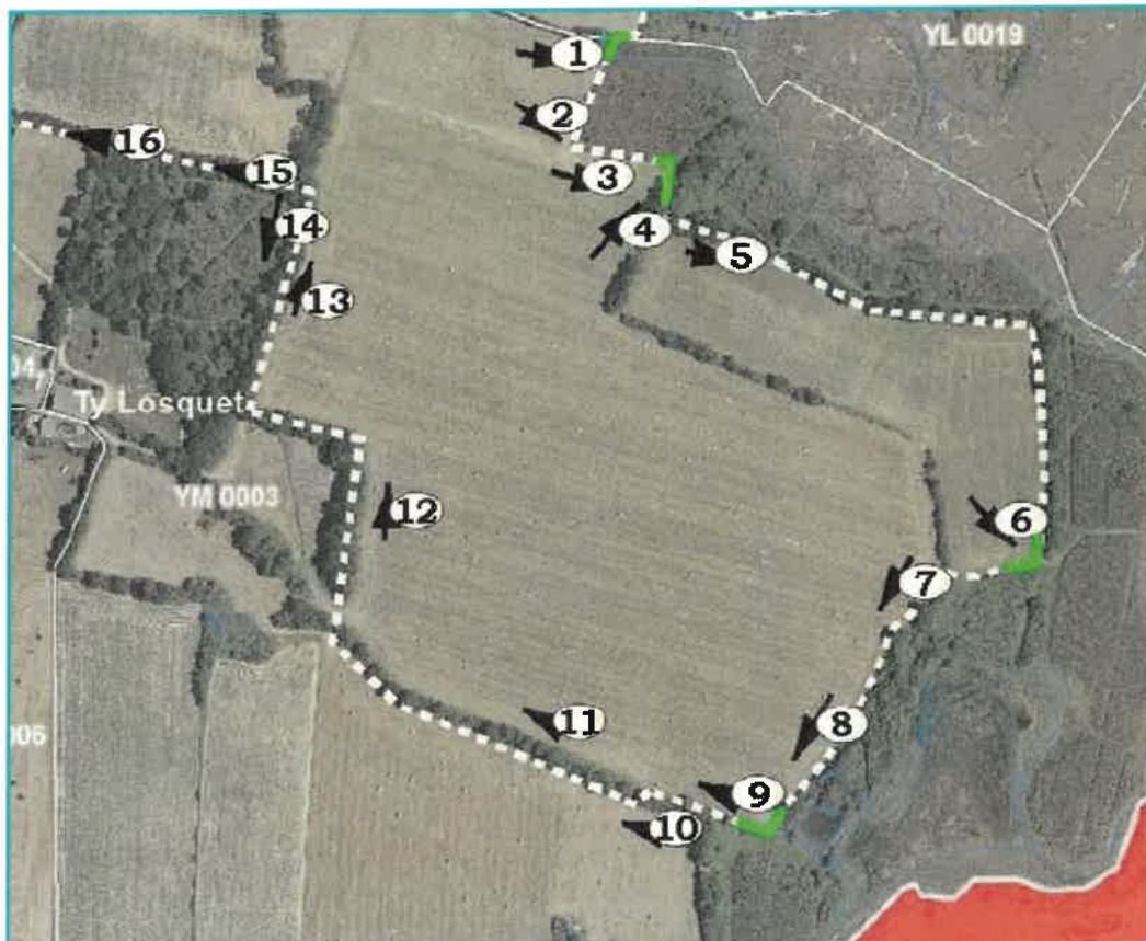
Tracé de la SPPL avec les n° des photos et leur orientation (flèches noires) En vert : sections en platelage sur pilotis