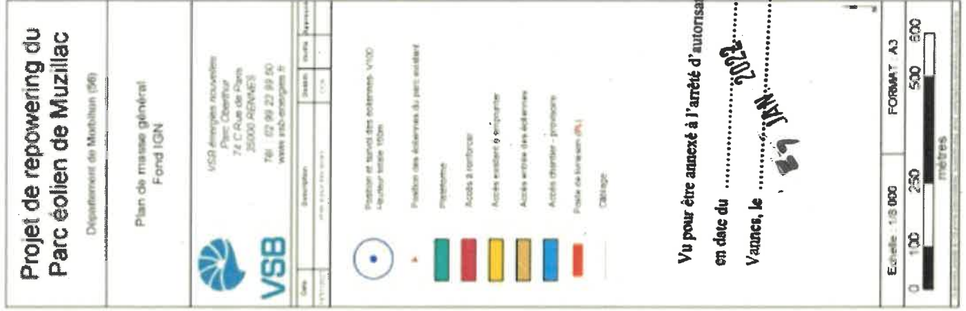
Figure 9 : Plan de masse général du projet de renouvellement sur fond IGN - Scénario avec les Vestas V100