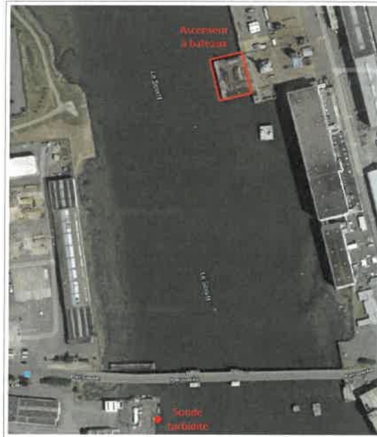
Carte 3 : Localisation de la sonde de suivi de la turbidité