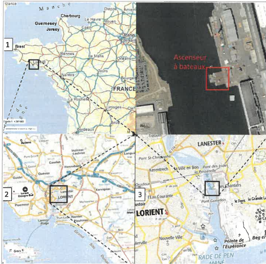
Carte 1 : Localisation des travaux