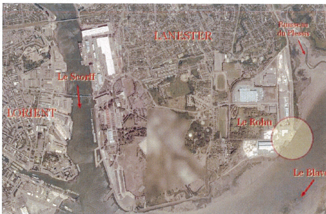
Localisation de la zone portuaire et industrielle du Rohu-Lanester (extrait étude d'impact)

Les installations de la zone industrielle et portuaire du Rohu datent des années 70 et le positionnement du quai sablier, très proche des berges de l'estuaire du Blavet, nécessite de pratiquer de fréquents dragages d'entretien pour maintenir la profondeur (la souille) à la côte marine adéquate 2 . Les difficultés d'accès nautique au quai 3 ne permettent pas aux entreprises sablières d'atteindre les quotas d'exploitation autorisés.