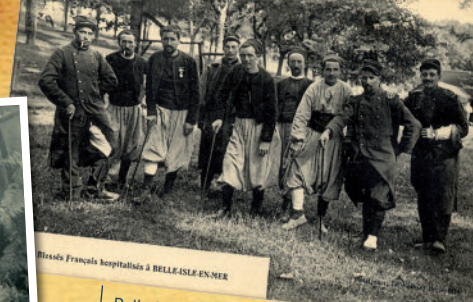
Belle-Isle-en-Mer, blessés français hospitalisés durant la Première Guerre mondiale