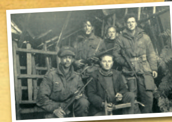
Trois hommes du Special Air Service (SAS), parachutistes de la France Libre, reconnaissables à leur tenue. Ils sont accompagnés de deux résistants.